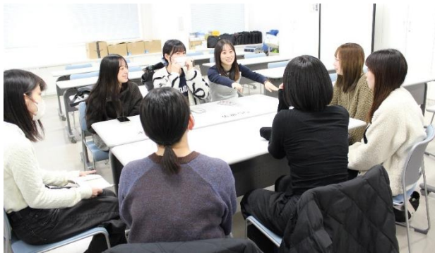
話が盛り上がり、話題が途切れなかった交流会