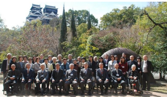
熊本城をバックに記念撮影する教職員OBたち

■本学教職員OB集う 第8回退職教職員の会が、2月28日（土）、熊本市中央区のKKRホテル熊本で開催され、OB教職員29人と現任教職員10人が参加しました。参加者たちは久しぶりの再会を喜び、近況を報告したり、思い出話に浸ったりと、話に花を咲かせていました。