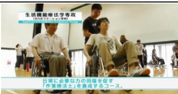
生活機能療法学専攻