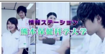
くまもと情報ステーション

7月7日(月)～11日(金)に熊本朝日放送の「情報ステーション」で5回に分けて本学の学科・専攻紹介がありましたので、一部ご紹介いたします。この映像は、オープンキャンパスでも流しています。