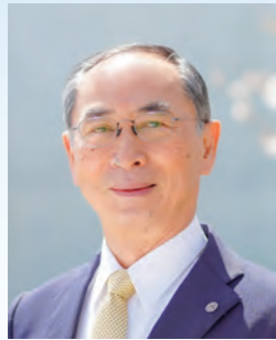
学校法人銀杏学園 理事長