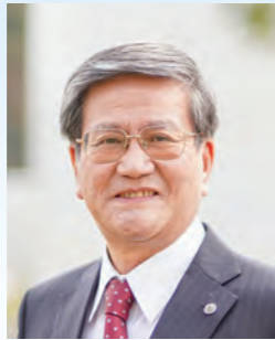
熊本保健科学大学 学長