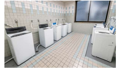
ランドリールーム