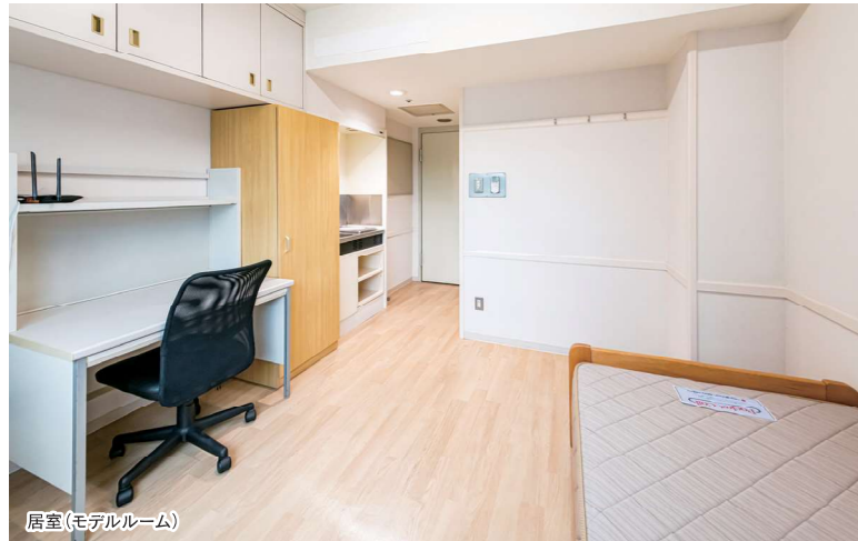
居室(モデルルーム)