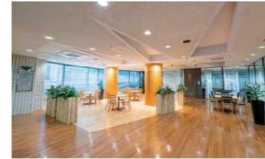
コミュニティスペース