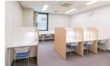
スタディールーム